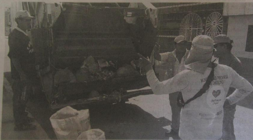
MPCh advierte que actividades de limpieza se cumplen con normalidad.