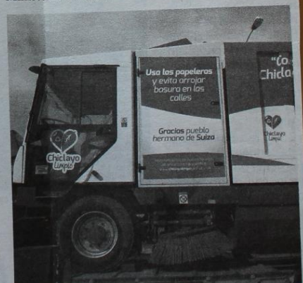
INCENTIVARÁN LA PROMOCIÓN DE LA ECONOMÍA LOCAL

te (Minam) y el executor la Municipalidad Provincial de Chiclayo (MPCH).