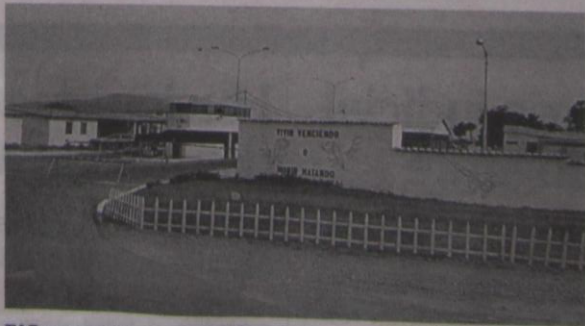
FAP entregará terreno para relleno sanitario.

De otro lado, señaló que se pondrá en debate en las próximas sesiones una ordenanza general de "uso de espacios públicos y buena convivencia comunitaria", la cual será como una norma marco que prohíba publicidad y propaganda en los espacios públicos.