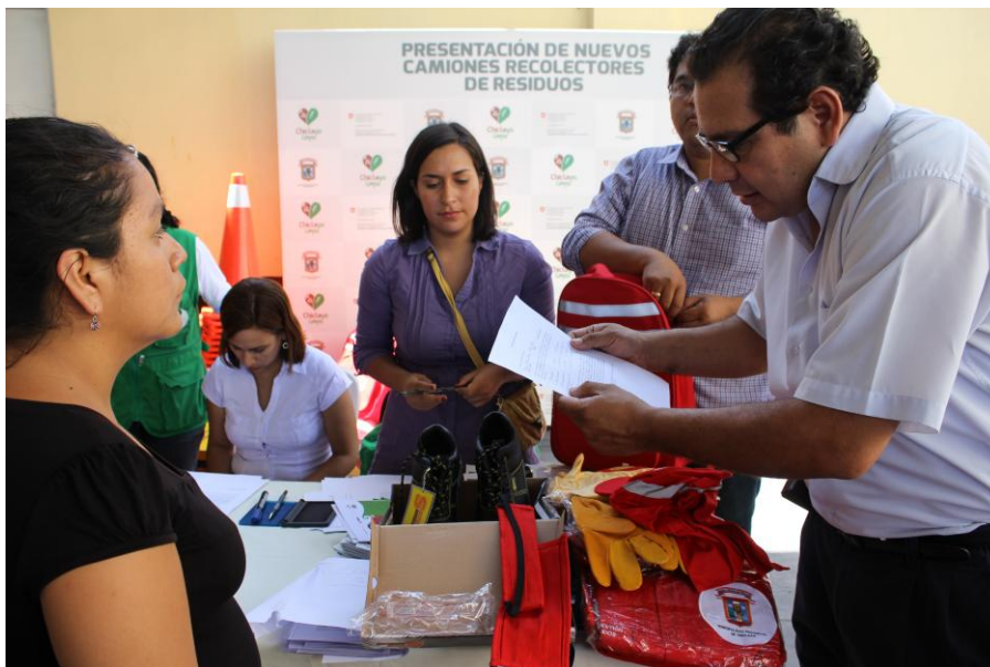
Foto 1: Obreros recibiendo dos juegos de uniformes y equipos de protección

Objetivo General: Mejorar las condiciones de vida de la población, la promoción de la economía local del turismo y la protección del medio ambiente.